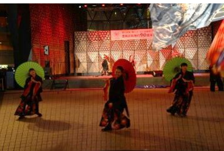
東京よさこい紅踊輝