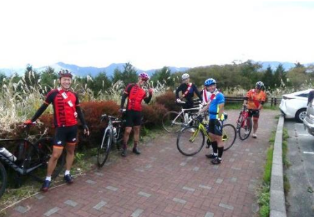
県道富士宮鳴沢線の展望台