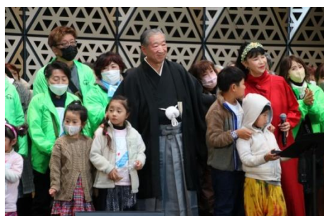
クローリングセレモニー