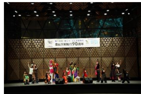
Action Club Katsu☆Kids