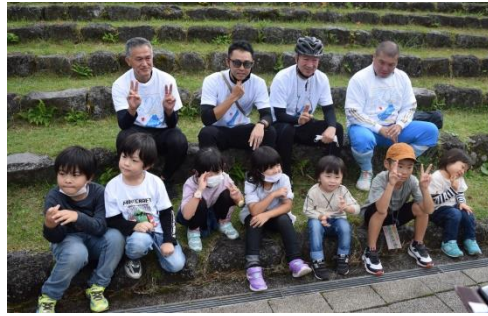
富士山 こどもの国