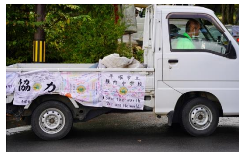
軽トラ サポートカー出動！