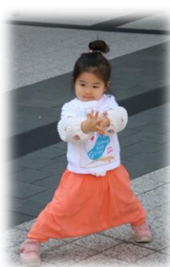
ダンスチームデビュー☆