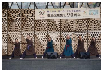
Umoya & Earth Rhythm