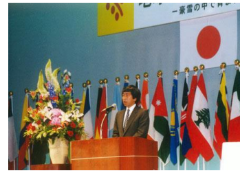
高円宮殿下 (オープニングスピーチの様子)

今、全国各地の稲作農家さんと一緒になって親子稲作体験お田植え祭・収穫祭を開催しております。