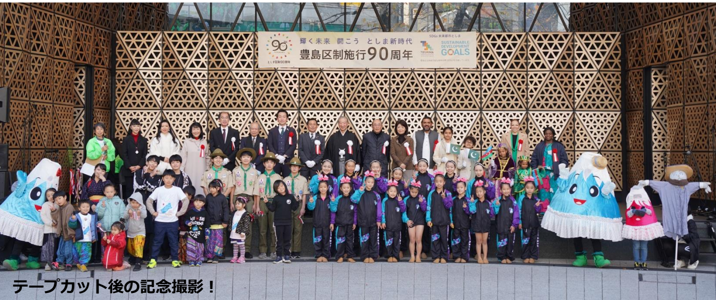
テープカット後の記念撮影！

12月とは思えない暖かな気候に恵まれた二日間、本会事業にご賛同くださいました皆様のご協力をいただき、23団体によるパワフルなパフォーマンス、9店舗のキッチンカー、各種出展ブースが並び、「未来の子ども達に美しい地球と和の心を残してあげたい」という私達の目的のもと、「稲作」、そして「稲作から始まった日本の伝統文化・芸能・食」を通じた、国際文化交流の場として盛り上げることができました。