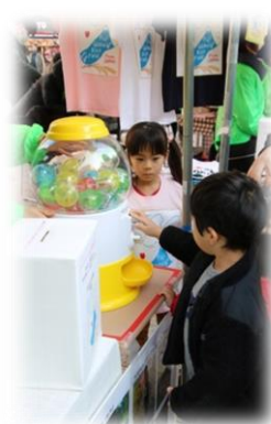
田の神さあガチャ！ 何が出るかな～？！