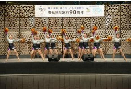
日本チアダンス協会 Team JCDA