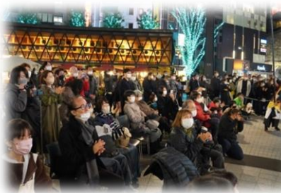
総踊りプログラム 「さあさみんなでどっこいしょ」