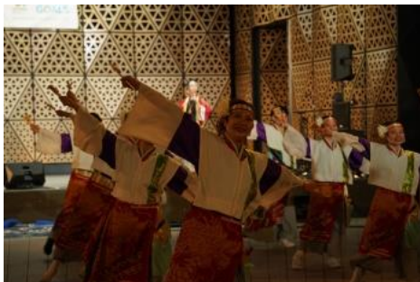
東京よさこい Summer Zipper