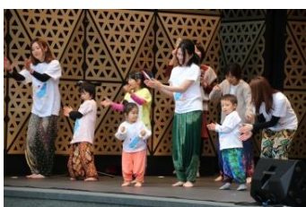
地球フェスタダンスチーム