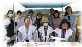
和歌山県 和歌山市