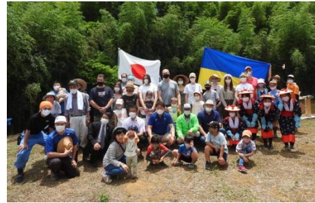
2021年 東京都稲城市での お田植え祭にて

これからも、子ども達の笑顔溢れる未来が訪れるまで、志を共にする方々と前進していきたいと思えます。