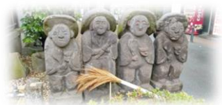
池袋水天宮の田の神さあ