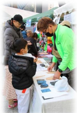
Myお箸だね！ お箸作りワークショップ