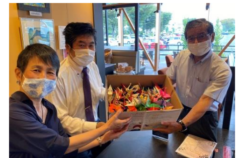
イオン大村ショッピングセンター (長崎県)