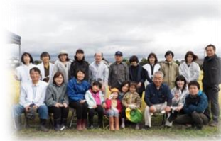
福島県 会津美里町