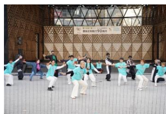
ベトナム海外交流チーム