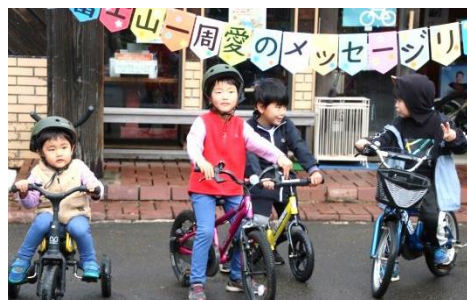
子ども達は山中湖で(^^)