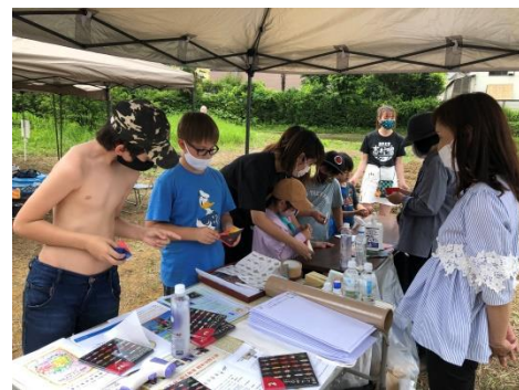
2021年 東京都稲城市で開催したお田植え祭会場にて ウクライナ大使館より大使、外交官の皆様がご家族で参加くださいました！