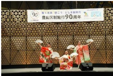
日本体育大学 伝統芸能専攻卒業生