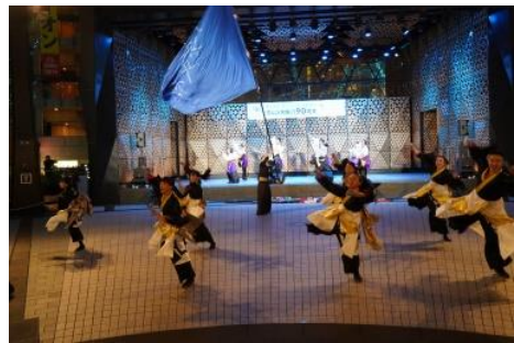
日本体育大学 舞桜 OB・OG混合チーム