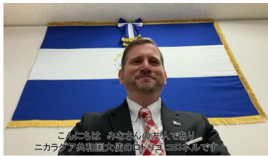
こんにちは みなさんの友人であり ニカラグア共和国大使のロドリゴコルテスです

これは、みんなのFUJISAN地球フェスタWAの応援メッセージボードと共に、世界平和への祈りを込めた折り鶴で、世界を繋ぐプロジェクトです。