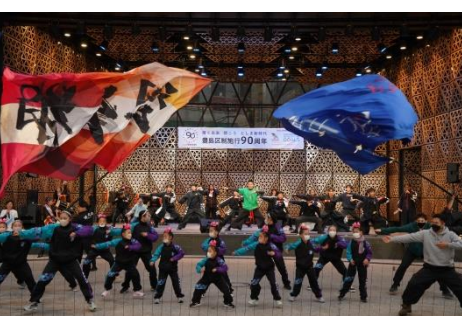
桜・翠天翔 南中ソーラン総踊り!