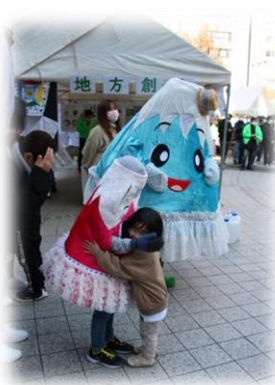
地球フェスタマスコット キャラクターと