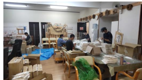
2022年8月玄米粉船便輸送の準備