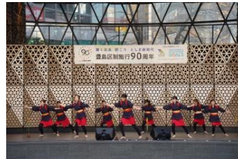
地球フェスタダンスチーム with 田の神さあ人