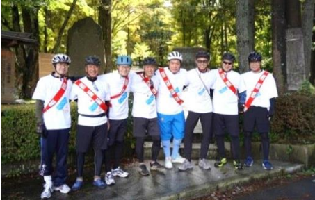
山中湖 旭日丘公園