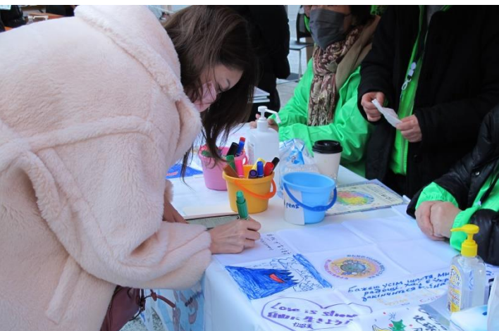
■ 応援メッセージボードブース