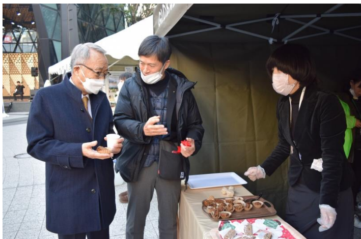
■ おもてなしエリア(玄米粉スイーツの試食)