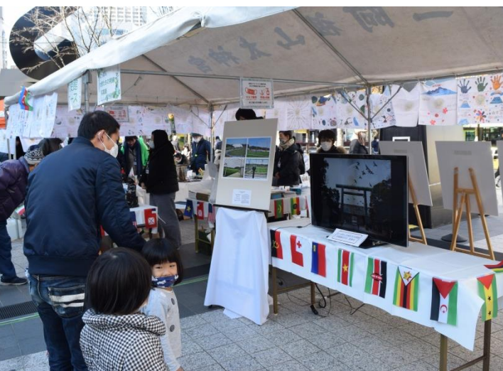
■ にっぽん大使たちの視線写真展ブース